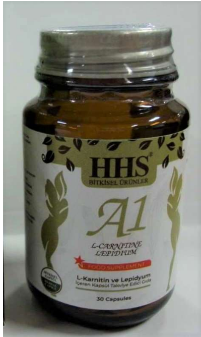
Fig.1: Imagen del producto HHS A1 L-CARNITINE LEPIDIUM cápsulas