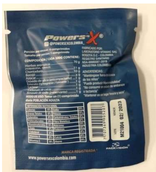
Fig.1: Imagen del producto Powers-X comprimidos