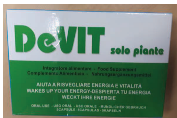
Fig.5: Imagen del producto DEVIT SOLO PIANTE CÁPSULAS .