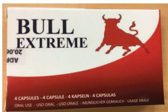
Fig.6: Imágenes del producto BULL EXTREME CÁPSULAS .