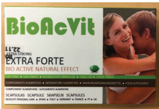
Fig.2: Imagen del producto BIOACVIT EXTRA FORTE CÁPSULAS .