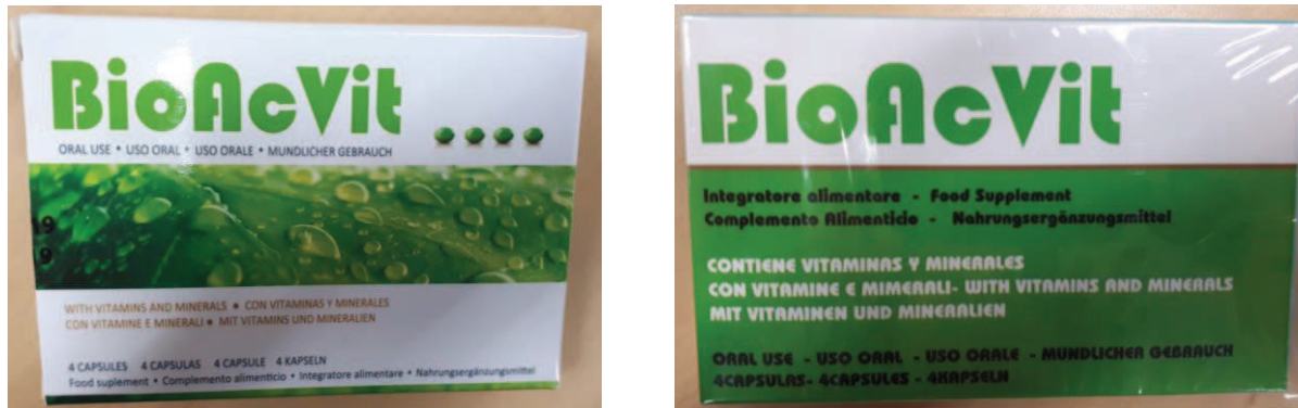
Fig.1: Imágenes del producto BIOACVIT CÁPSULAS .

La información, permanentemente actualizada, de todos los medicamentos autorizados y controlados por la AEMPS está disponible en la web de la Agencia, www.aemps.gob.es , dentro del apartado Centro de Información online de Medicamentos Autorizados (CIMA) .