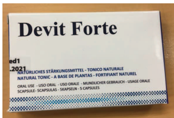
Fig.4: Imagen del producto DEVIT FORTE CÁPSULAS .